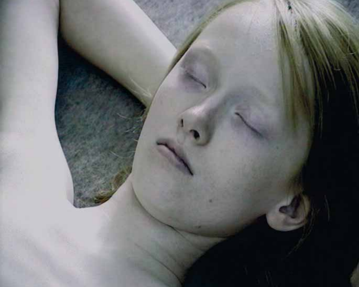
El mundo de las imágenes